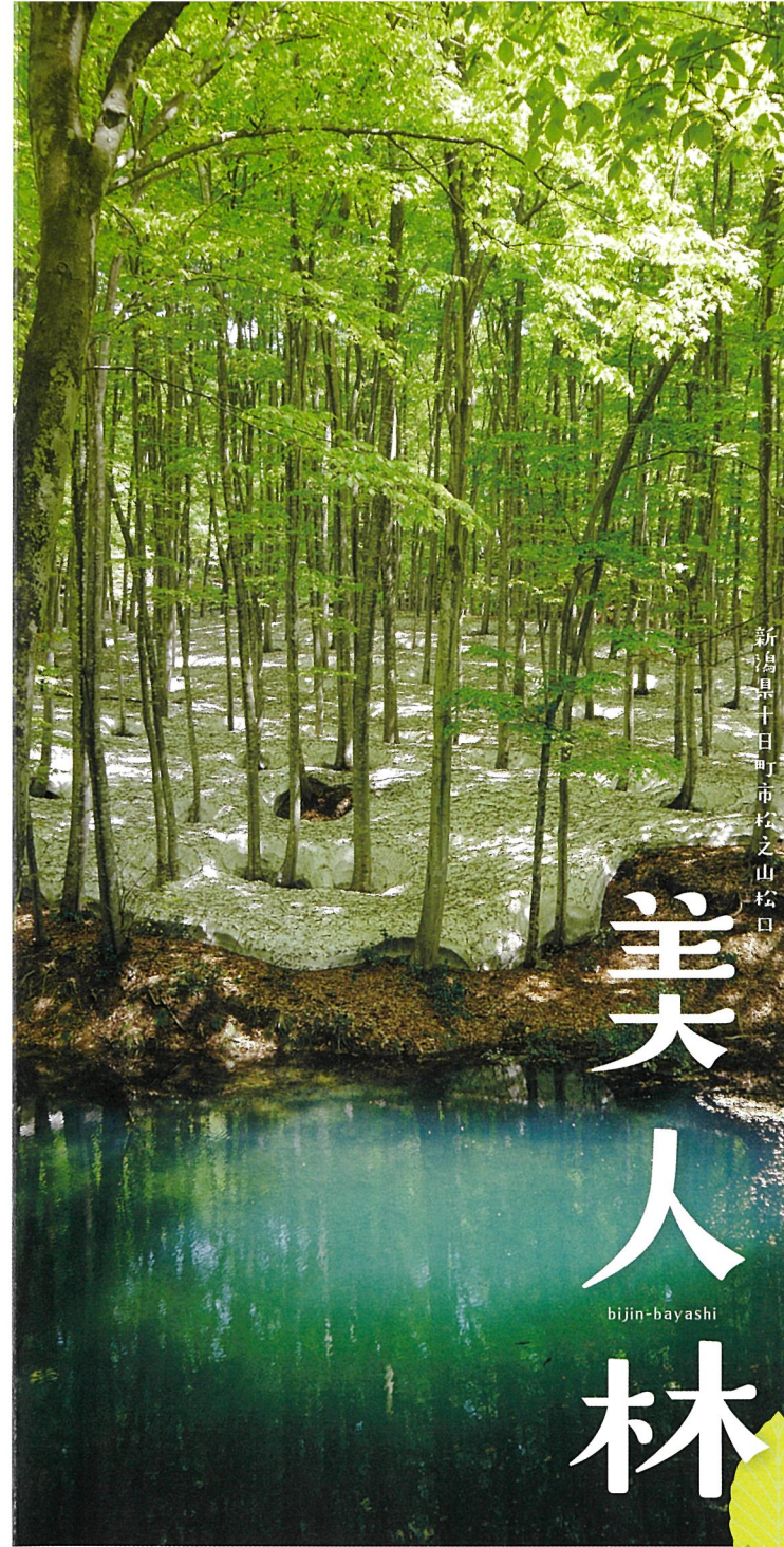
新潟県十日町市松之山松口

編集協力：十日町市立里山科学館「森の学校」キョロ口 参考資料：「雪里のブナ林のめぐみ」